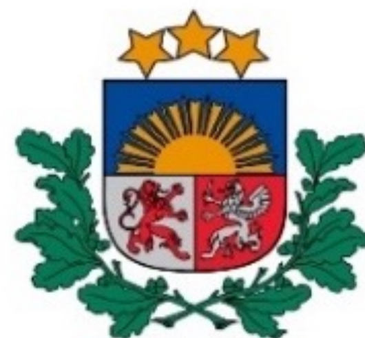
Sabiedrības integrācijas fonds